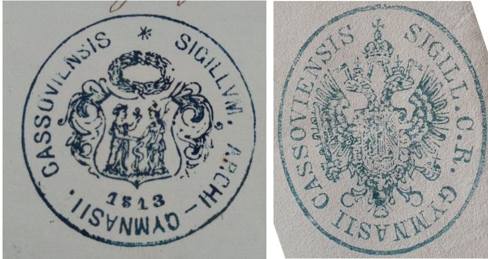
Pečiatky: * SIGILLVM. ACHI – GYMNASII. CASSOVIENSIS 1813 a SIGILL. C. R. GYMNASII CASSOVIENSIS

V školskom roku 1861/62 sa po navrátení školy do správy premonštrátskeho rádu zmenil jej úradný názov na Katolícke hlavné gymnázium (Kassai katolikus főgymnázium) .