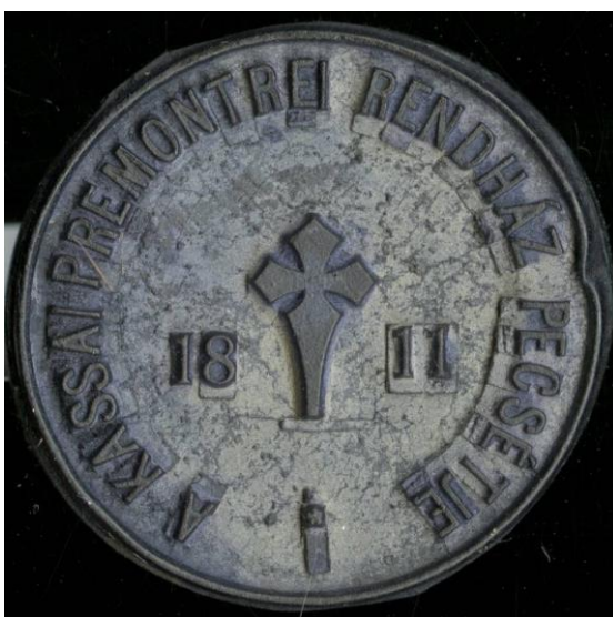
Pečiatkovadlo: * A KASSAI PREMONTREI RENDHÁZ PECSÉTJE 18 † 11

V roku 1654 sa sídlo kapitána presťahovalo do Bornemiszoého domu a cisár Ferdinand III. daroval Kráľovský dom jezuitom, aby tu zriadili kláštor a kolégium. Jezuiti získali neskôr aj susedné domy a spolu s bývalým Kráľovským domom ich postupne upravovali. Od roku 1657 tu bolo sídlo Košickej univerzity. Po zrušení jezuitského rádu došlo k zmene postavenia kostola a rehoľného domu, do správy premonštrátskeho rádu však boli tieto objekty zverené až v roku 1811.