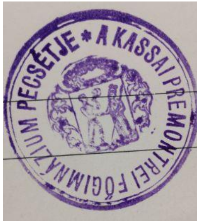
Pečiatka: * A KASSAI PREMONSTRÉI FŐGIMNÁZIUM PECSÉTJE