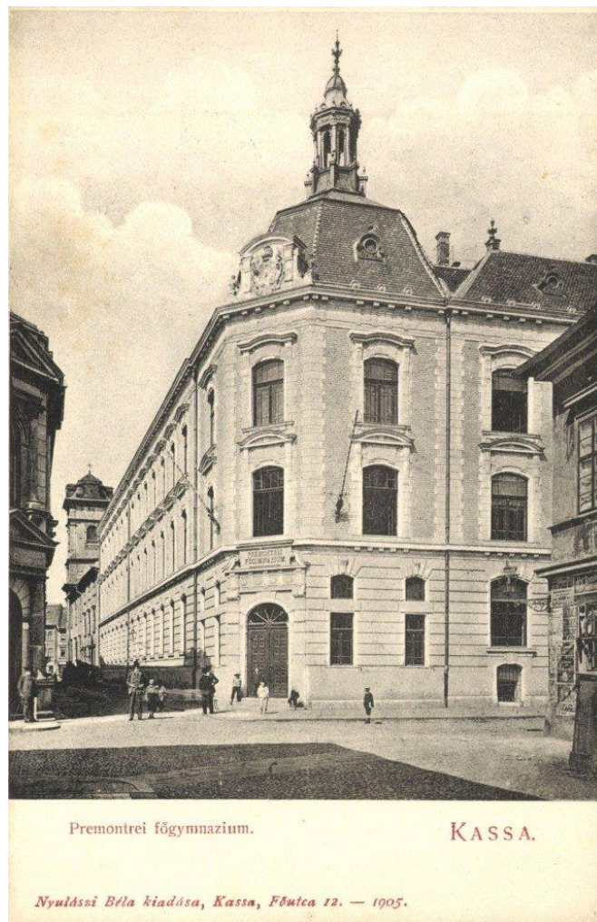
Budova HGP na začiatku 20. storočia

vysoko kvalifikovanými učiteľmi. Od reštitúcie rádu až do vzniku Československa pôsobili na pozíciách pedagógov či riaditeľov takmer všetci predstavitelia jasovského prepoštvstva.