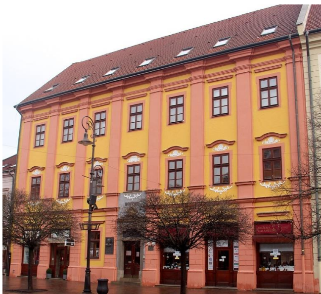
Budova niekdajšieho šľachtického konviktú v Košiciach na Hlavnej ulici č. 91