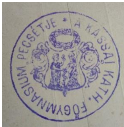
Pečiatka: * A KASSAI KATH. FŐGYMNASIUM PECSÉTJE

V školskom roku 1861/62 sa po navrátení školy do správy premonštrátskeho rádu zmenil jej úradný názov na Katolícke hlavné gymnázium (Kassai katolikus főgymnázium) .